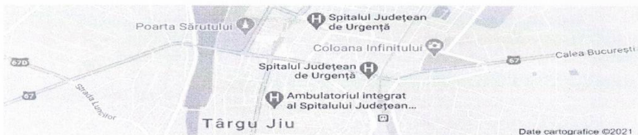
Figura 1-Localizarea pe hartă a Spitalului Județean de Urgență Târgu Jiu

În anul 2023, Spitalul Județean de Urgență Târgu Jiu a funcționat conform ultimei modificări a structurii organizatorice, aprobată prin Dispoziția Președintelui Consiliului Județean Gorj nr. 1050 din 11.12.2019, cu un număr de 1009 paturi spitalizare continuă și 69 paturi spitalizare de zi, distribuite în 22 de secții și un compartiment, din care 67% reprezintă paturi pentru specialități medicale, 29% din paturi pentru specialități chirurgicale și 4% din paturi pentru specialități ATI, amplasate în cele trei locații ale spitalului.